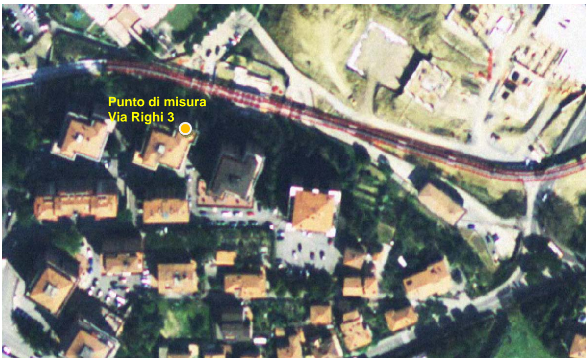
Figura 1: Ortofoto della zona nei pressi della Stazione di Madonna Alta; indicazione del punto di misura presso l'edificio di Via Righi 3.

Nella ortofoto di figura 1 è indicata la posizione del punto di misura presso l'edificio di Via Righi 3.