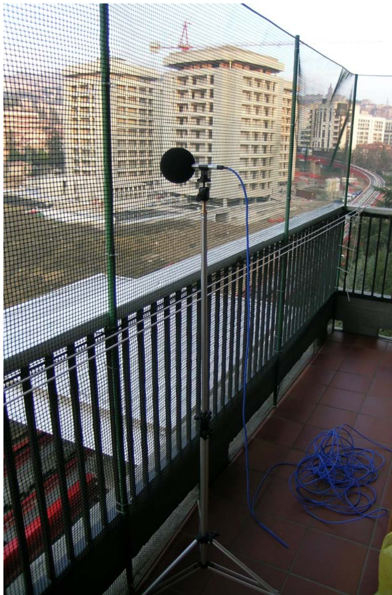
Figura 2: Postazione di misura presso l'edificio di Via Righi 3

La documentazione fotografica del punto di misura è riportata nella figura seguente.